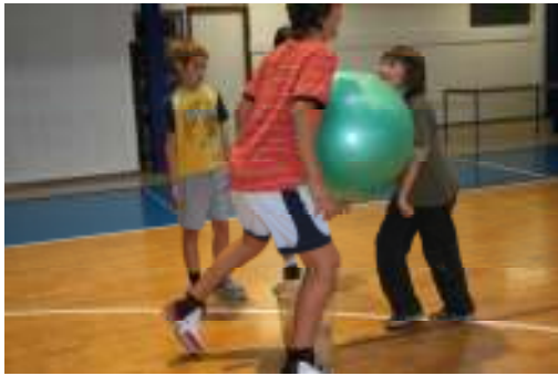
Zabava in smeh.....