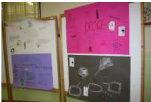
Nastali so zelo domiselni plakati.