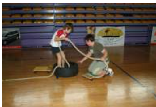
FIT igre- dečka sta se resno lotila dela.