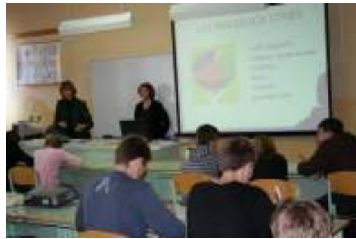
Resno delo- predavanje o stresu.