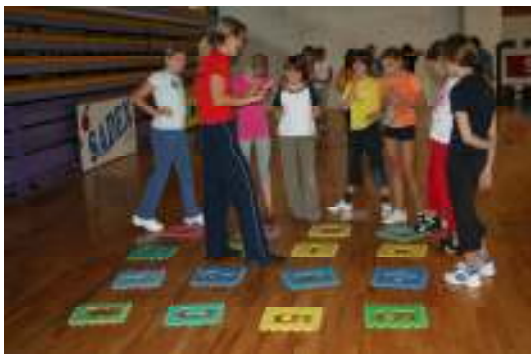
Dobro opazuj in se pripravi.