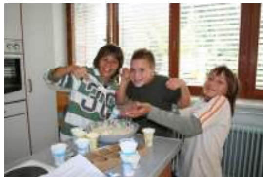
Priprava mlečnih napitkov je lahko nadvse zabavna.